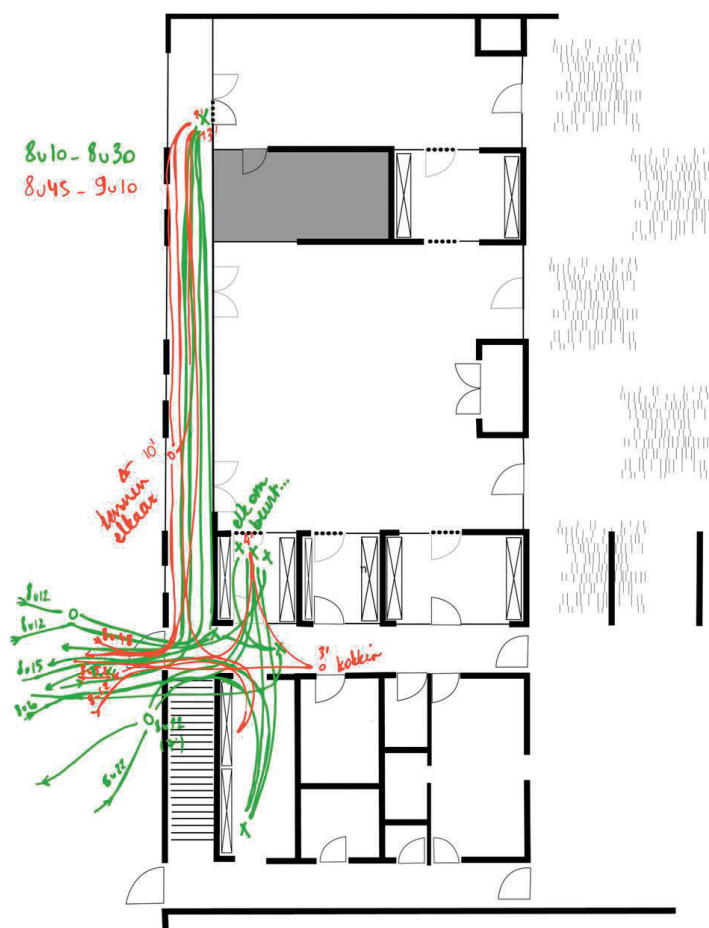
Opvallend genoeg bepaalt ook de inrichting van de ruimte het gedrag van ouders.

Een andere manier is om tijdens het brengen en halen met verschillende ouders tegelijk te praten over de activiteiten van de afgelopen dag. Kindeigen informatie geef je nog