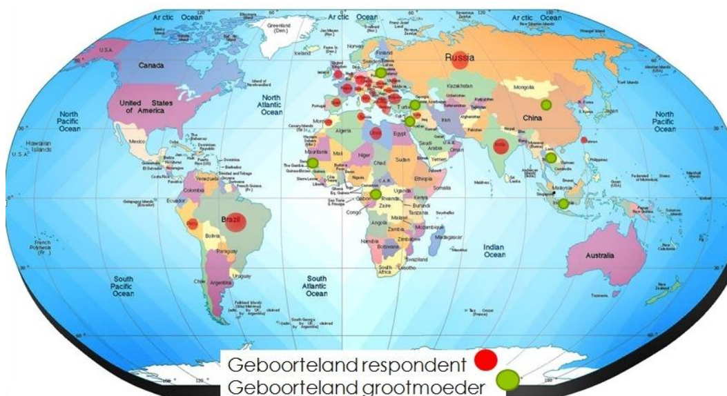
Figuur 1: Geboorteland van respondent en grootmoeder o.b.v. schriftelijke survey.

De schriftelijke survey leert ons dat voor 47% van de respondenten het geboorteland België is, en 57% van de respondenten heeft de Belgische nationaliteit. Het geboorteland van de oma van het kind langs moederszijde is voor 36% van de respondenten België, voor 19% van de respondenten is dit Marokko. De overige geboortelands van de oma van het kind zijn: Albanië, Brazilië, Bulgarije, China, Congo, Duitsland, Frankrijk, Griekenland, Groot-Brittannië, India, Indonesië, Italië, Joegoslavië, Kroatië, Libanon, Macedonië, Marokko, Nederland, Oekraïne, Oostenrijk, Peru, Polen, Roemenië, Rusland, Senegal, Spanje, Syrië, Taiwan, Thailand, Tunesië, Turkije, en Zwitserland. De schriftelijke vragenlijst toont bijgevolg dat er een divers publiek naar de ontmoetingsplaatsen komt. Dit wordt weergegeven in Figuur 1.