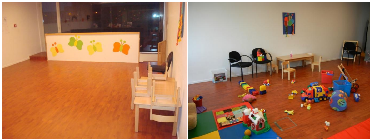
Foto: De Speelbabbel Luchtbal 'voor' en 'tijdens' ontmoetingsmoment

Wanneer ontmoetingsmomenten plaatsvinden in een consultatieruimte van Kind & Gezin of een kinderdagverblijf wordt de ruimtelijke indeling ervan voor aanvang van het openingsmoment volledig gewijzigd om dat welkomstgevoel te installeren.