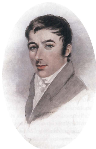
Portret van Robert Owen

leren observeren. Owen nam afstand van het oude 'monitorial'-systeem, waarbij de nadruk lag op toezicht en vermaningen en slechts enkele kleuteronderwijzers toezicht hielden over grote groepen leerlingen. Hij stelde op zijn eigen instituut