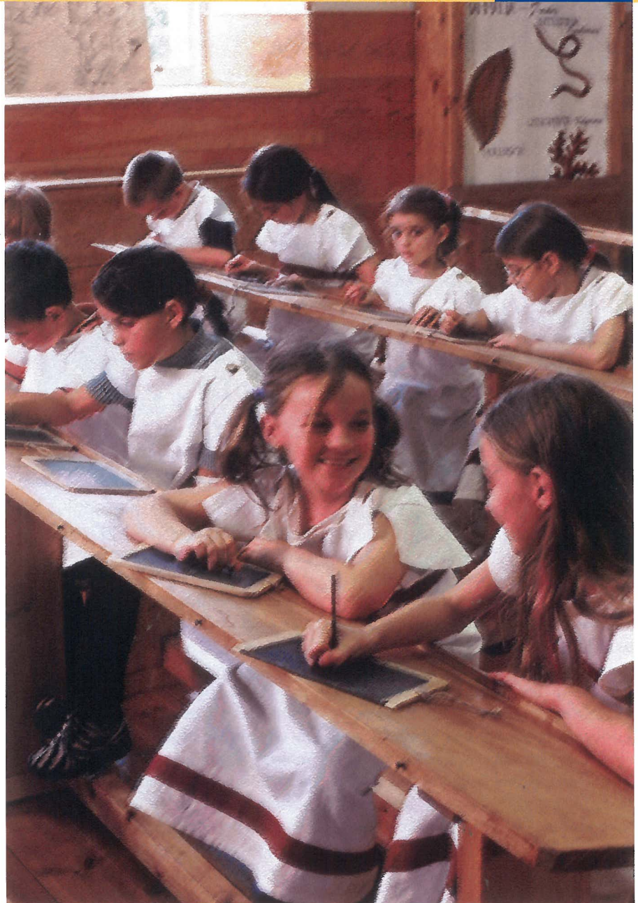
Bezoekers in een historisch klaslokaal

'Joining up services' is een ander begrip dat hoog op de prioriteitenlijst staat. Onderzoek in 2001 wees namelijk uit dat voorzieningen vaak slecht samenwerkten en dat er geen beleid was ten aanzien van