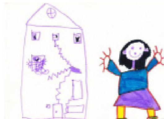
Laura, 5 ans et 9 mois, dessin de soi à l'école

Dès le plus jeune âge, les enfants apprécient avoir des tâches et responsabilités adaptées à leurs compétences (par ex. ranger les bols de soupe, se servir). Cela stimule leur sentiment de compétence et renforce leur engagement envers la vie en crèche et à l'école. Nous avons également observé que la présence de règles en nombre limité, fondées sur des valeurs claires et stables dans le temps, influence positivement le sentiment de compréhension et de sécurité de l'enfant. Inversement, un manque d'explicitation et de stabilité