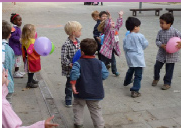
Lieux de décompression