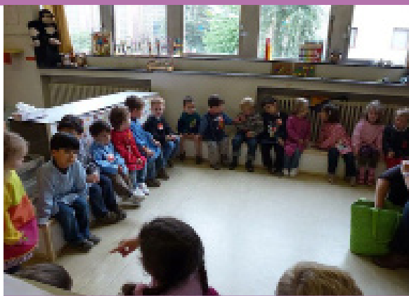
Échanges et partages entre les enfants lors d'une activité